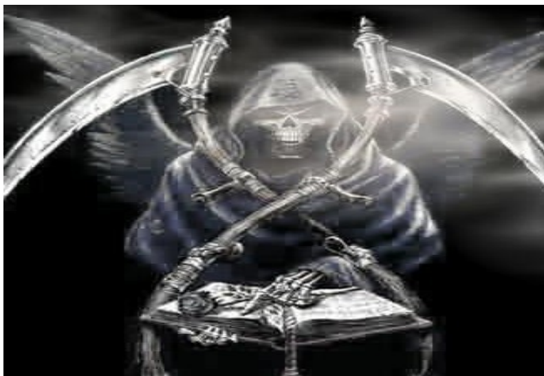
Imagem - Internet