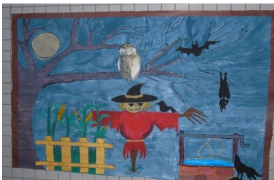
Imagem – Emmyle Moraes