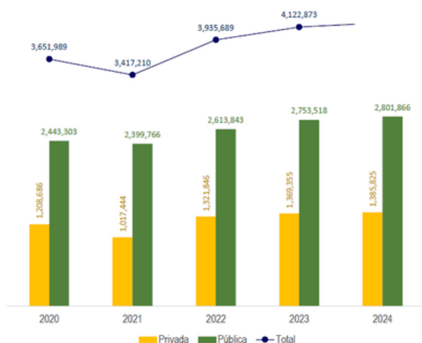
Gráfico 12. Evolução das matrículas em creche por rede de ensino - Brasil 2020-2024