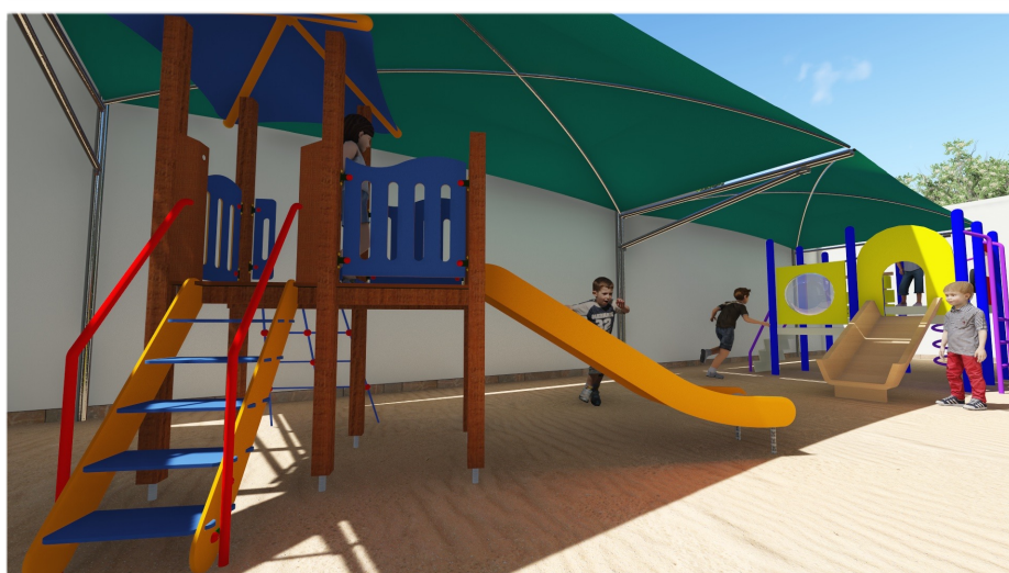
Playground New Big Play