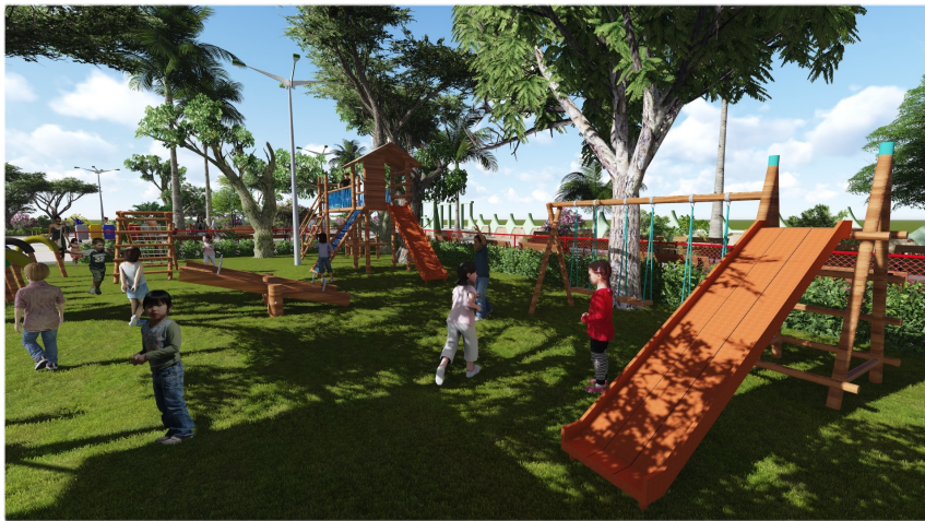
Brinquedos temáticos e interativos