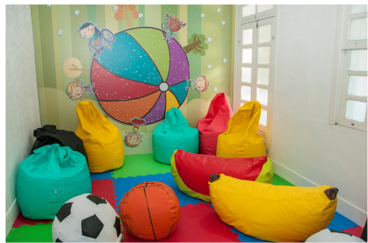
Sala de Cinema