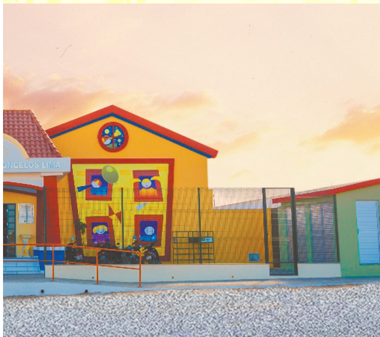
Centro de Educação Infantil - CEI