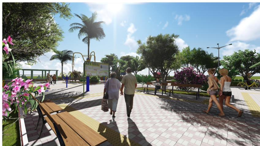
Área de Convivência