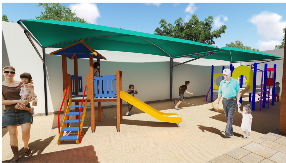
Área de Convivência