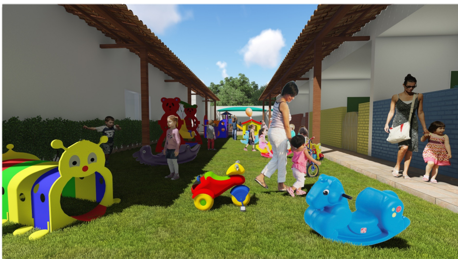
Brinquedos (centopeia, triciclos, anda cavalinho)