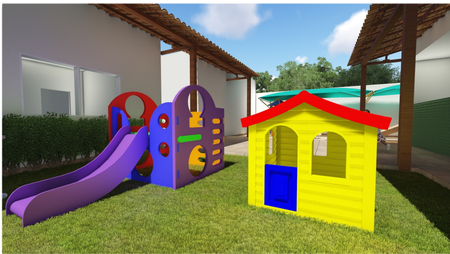
Escorregador desmontável e casinha encantada