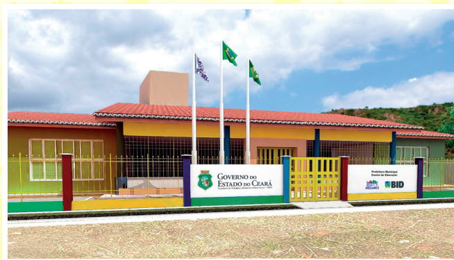
Modelo Creche PROARES