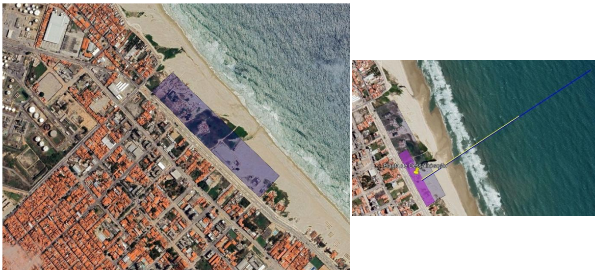
Figura 3. Área disponibilizada pela SPU com destaque para área necessária para comportar a Planta de Dessalinização.

Seguindo decisão governamental, a CAGECE solicitou a alteração do local de implantação à SPE informando a disponibilização de uma área de 88.300 m 2 (Figura 3), em processo de cessão pela SPU. Após análise, a SPE verificou que, por utilizar apenas cerca de 25.000 m 2 da área, a planta poderia ser locada em uma fração ao sul dentro terreno, mantendo-se o posicionamento original das infraestruturas offshore (tubulações de captação de água marinha e emissário) e resguardando os padrões de afastamento indicados pelo Comitê Internacional de Proteção de Cabos (ICPC) e ANATEL. À medida que o redesenho da planta evoluiu neste semestre, a SPE identificou a necessidade de um pequeno aumento de área para 26.330 m 2 .