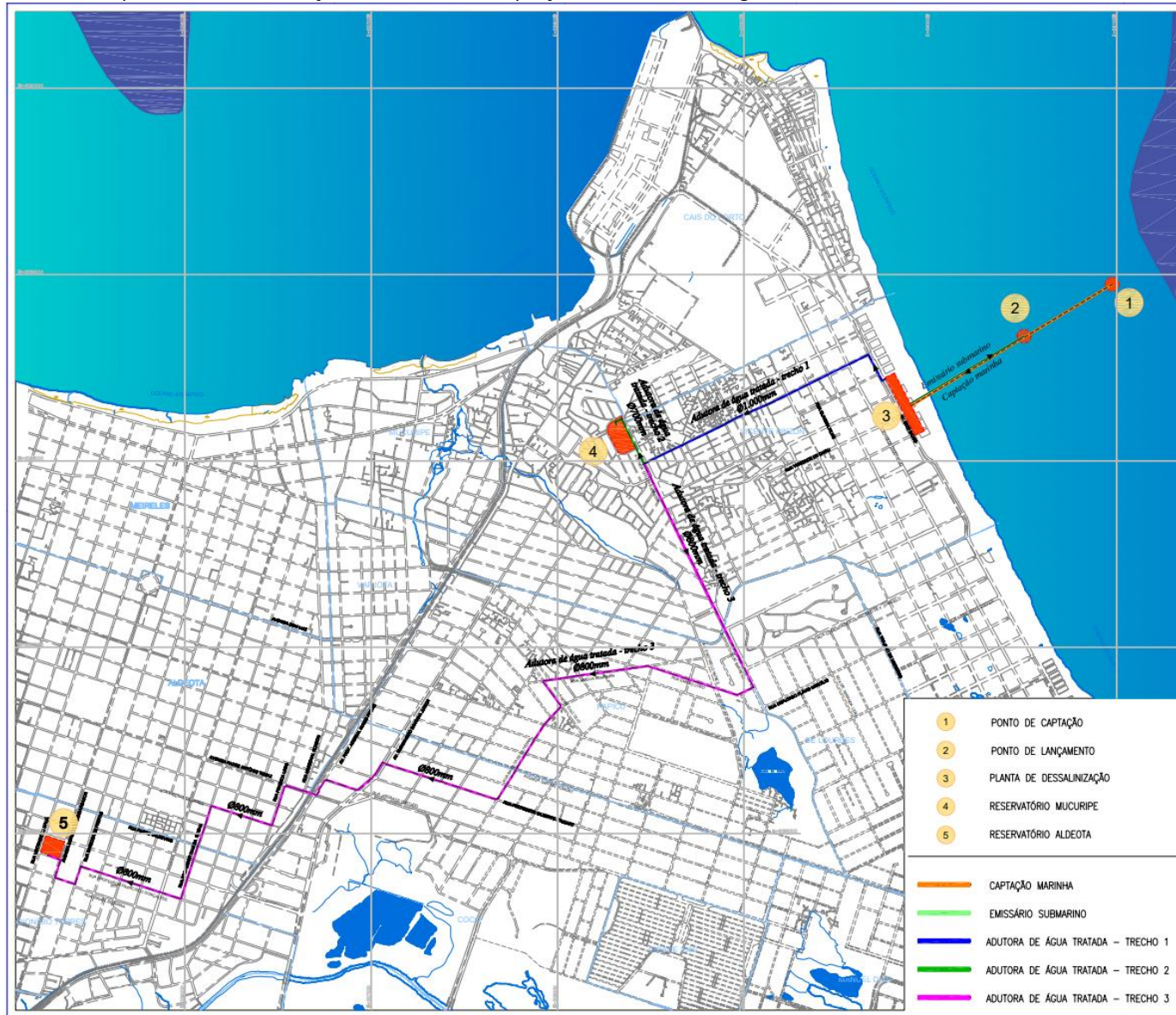
Figura 1. Localização da área da planta de dessalinização e das linhas de captação, emissário e de água tratada.