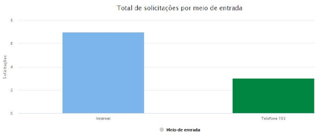
Meios de entrada

Já os meios de entradas utilizados se dividiram entre as ligações pelo 155 com 3 (três) ligações representando 30% das demandas e via internet com 7 (sete) acessos através do Portal da Transparência, representando 70% das demandas como mostra o gráfico abaixo.