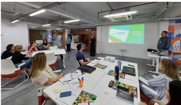
Oficina de Planejamento Estratégico no espaço multiuso do Laboratório Íris