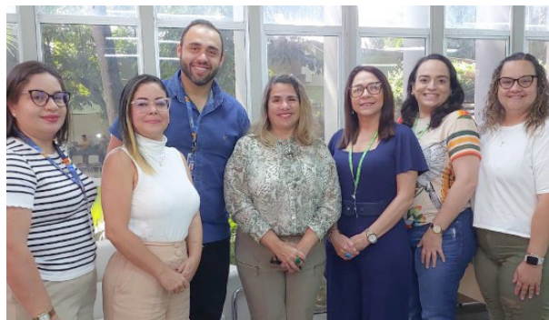
Representaram a Escola de Formação de Maceió e da Escola de Gestão Pública do Estado do Ceará – EGPCE

Durante toda a semana, as equipes das secretarias das Relações Internacionais, pela manhã, e da Diversidade, à tarde, participaram da capacitação. As oficinas vão ser realizadas no espaço multiuso do Laboratório Íris e terão como facilitador o consultor Wilton Bessa, servidor da Secretaria da Fazenda (Sefaz-CE) com larga experiência em planejamento.