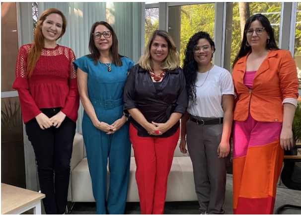
Representantes da Vara de Execução de Penas e da Escola de Gestão Pública do Estado do Ceará – EGPCE