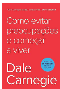
Como evitar preocupações e começar a viver Dale Carnegie, Editora Sextante. 1ª edição, 2020

INDICAÇÕES . INDICAÇÕES . INDICAÇÕES . INDICAÇÕES . INDICAÇÕES . INDICAÇÕES