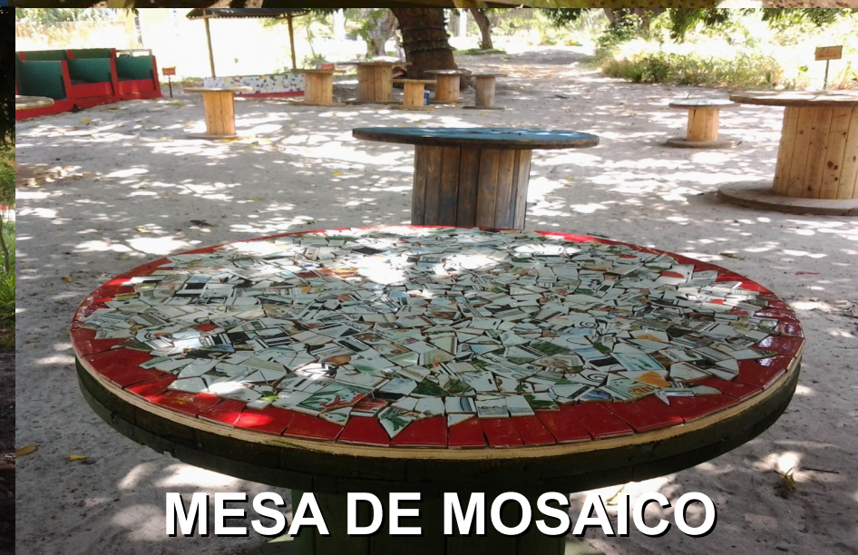
MESA DE MOSAICO