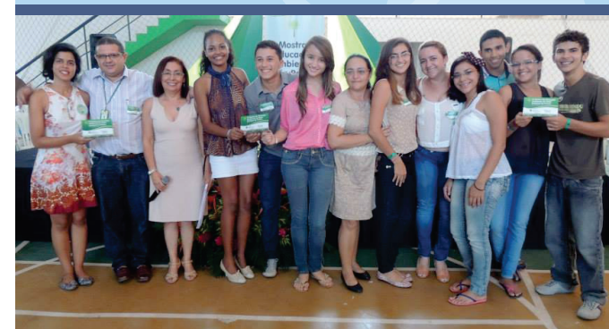
Participantes da III Mostra da Educação Ambiental da Rede Estadual de Ensino, 2013

Fortaleza, CE 16 e 17 de dezembro de 2014