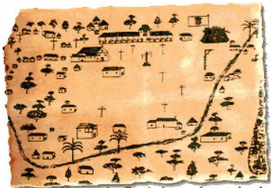
Mapa de Fortaleza desenhado em 1726 pelos padres jesuitas

“Não existe maior inimigo da natureza do que aquele que se julga mais inteligente que ela, sem perceber que ela é a nossa melhor escola 2 .”