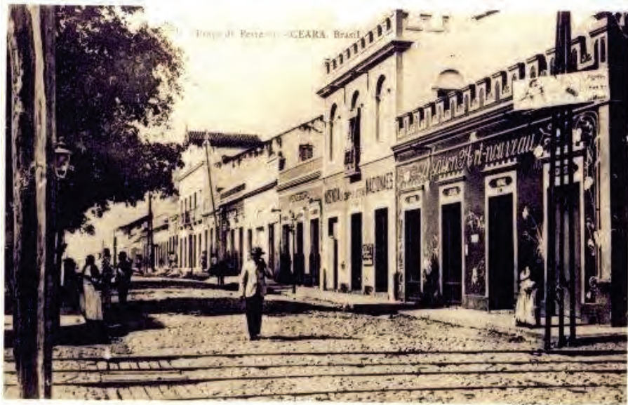
Praça do Ferreira – Ceará – Brasil – 1914

“O ano de 1800 deveria ter sido bissexto, isto é, com 366 dias, mas, não sabemos o porquê, não o foi, ficando o calendário atrasado em um dia até 1817, quando foi colocado um dia para compensar.”