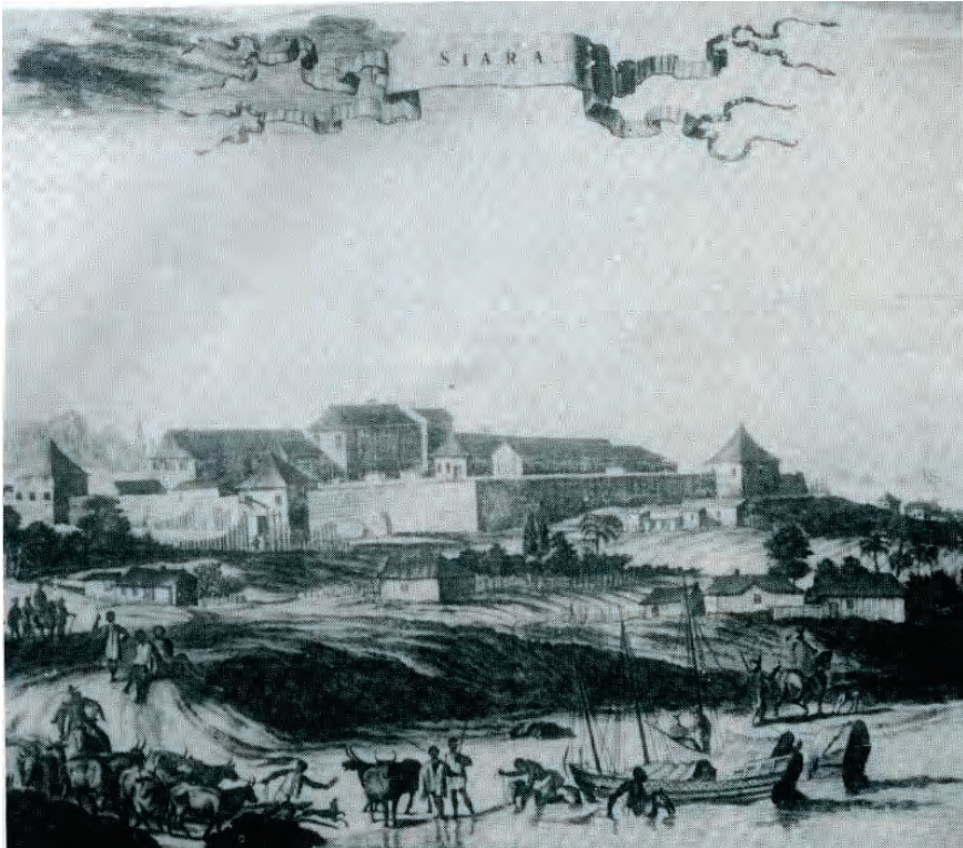
(1613 – Forte de São Sebastião - Nirez)

Só a Morte sobreviverá. Além do Juazeiro!