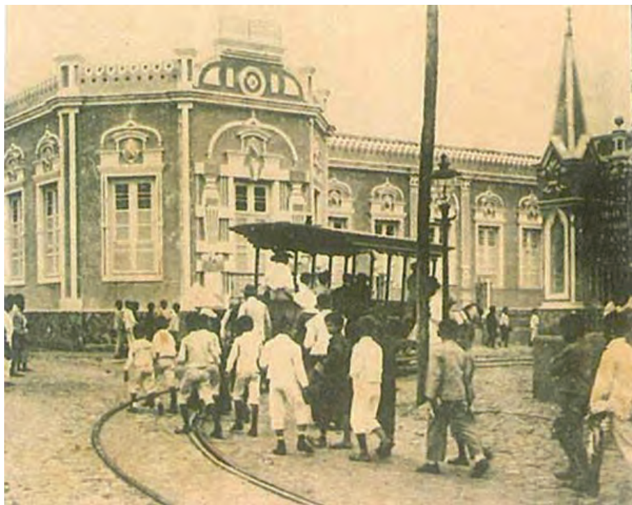
(Fortaleza – Ceará)

“Ó mago, ó Simão 16 e seus míseros imitadores, pelos quais as graças divinas inseparáveis da bondade são adulteradas e trocadas por ouro e prata! Por ti e pelos teus soa a trompa suplicante; eis que estais enterrados na terceira cova!” 17