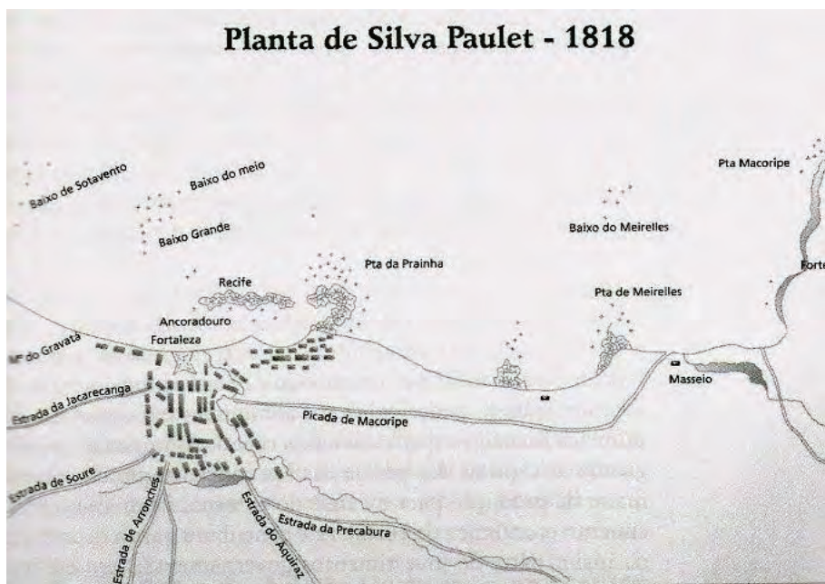
(Fortaleza - Ce)

Então, da costela do dia, Ngoamã fez a noite e tudo anoiteceu naqueles dias, sobretudo a vida de Siriará. O deserto daquele lugar chorou um choro seco e árido, somente banhado pelo sangue daquela gente. Homens, então, se chamaram índios, negros, brancos, mamelucos, cafuzos, cabras, caboclos e tantos outros que um dia se cansaram de tanta nomenclatura e denominaram-se apenas homens.