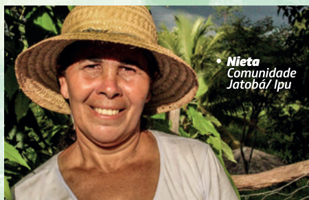
• Nieta Comunidade Jatobá/ Ipu

lhada dentro da agroecologia e da convivência com o semiárido. Essa realidade precisa mudar. Como diz a Campanha pela justa divisão do trabalho doméstico: Direitos são para mulheres e homens. Responsabilidades também!