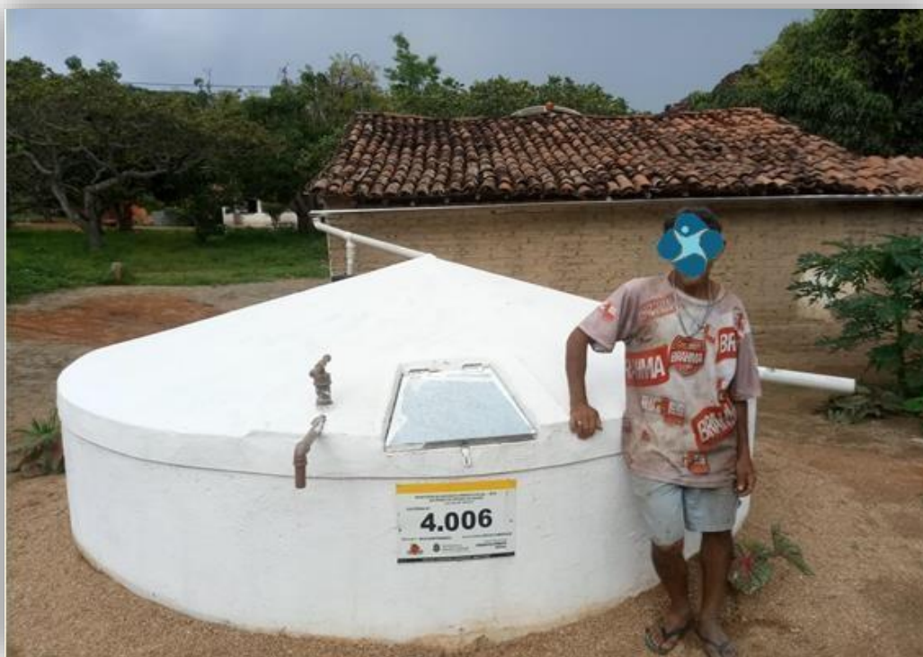
Foto 1: Visualização da tampa, bomba manual, placa de identificação e do beneficiário

Além disso, os técnicos de campo deverão realizar pelo menos um registro fotográfico do beneficiário junto à tecnologia, em tomada que apresente a placa de identificação com o número da cisterna ( conforme modelo padrão especificado no Apêndice IV ), a tampa, a bomba manual, o sistema de descarte da primeira água da chuva e as calhas de ligação da cisterna à casa do beneficiário, anexando-o ao Termo de Recebimento.