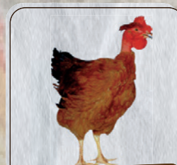
Pescoço pelado vermelho